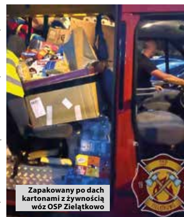
Zapakowany po dach kartonami z żywnością wóz OSP Zielątkowo