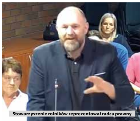
Stowarzyszenie rolników reprezentował radca prawny