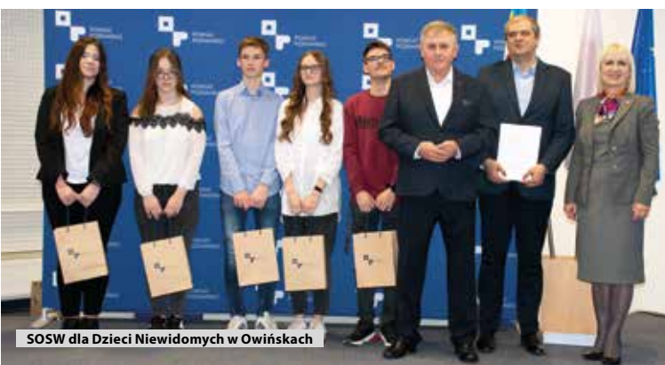
SOSW dla Dzieci Niewidomych w Owińskach