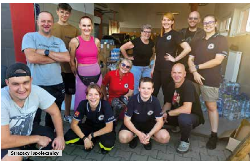
Strażacy i społecznicy