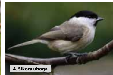
4. Sikora uboga