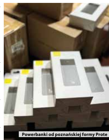
Powerbanki od poznańskiej formy Prote

Nasza rozmówczyni dodaje, że w akcji pomocowej udział wzięło też Stowarzyszenie Rolników Indywidualnych i Producentów Żywności z Chłudowa, które wysłało do Trze-