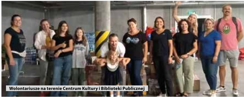
Wolontariusze na terenie Centrum Kultury i Biblioteki Publicznej