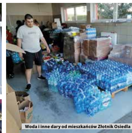
Woda i inne dary od mieszkańców Złotnik Osiedla