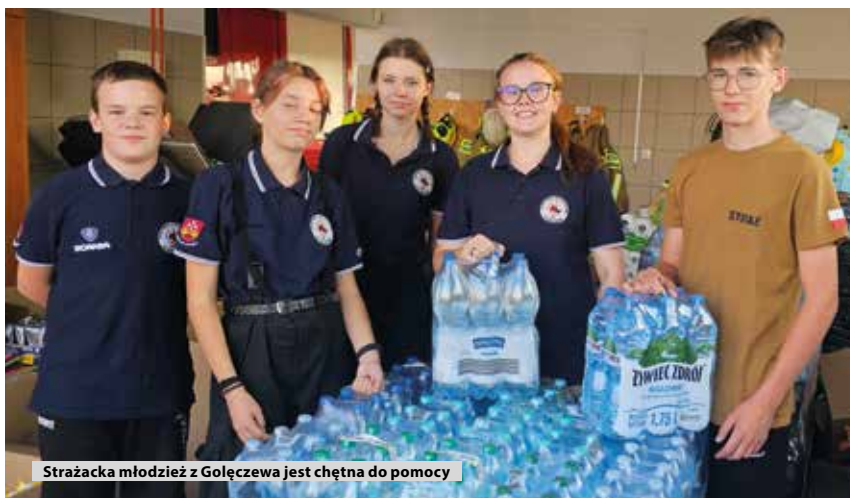
Strażacka młodzież z Gołęczewa jest chętna do pomocy