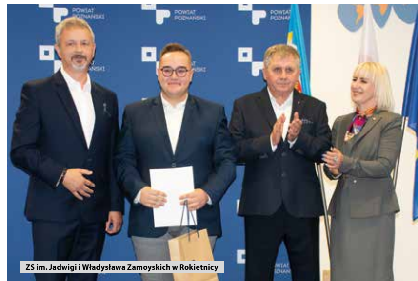
ZS im. Jadwigi i Władysława Zamojskich w Rokietnicy