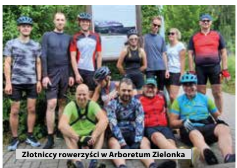
Złotniccy rowerzyści w Arboretum Zielonka