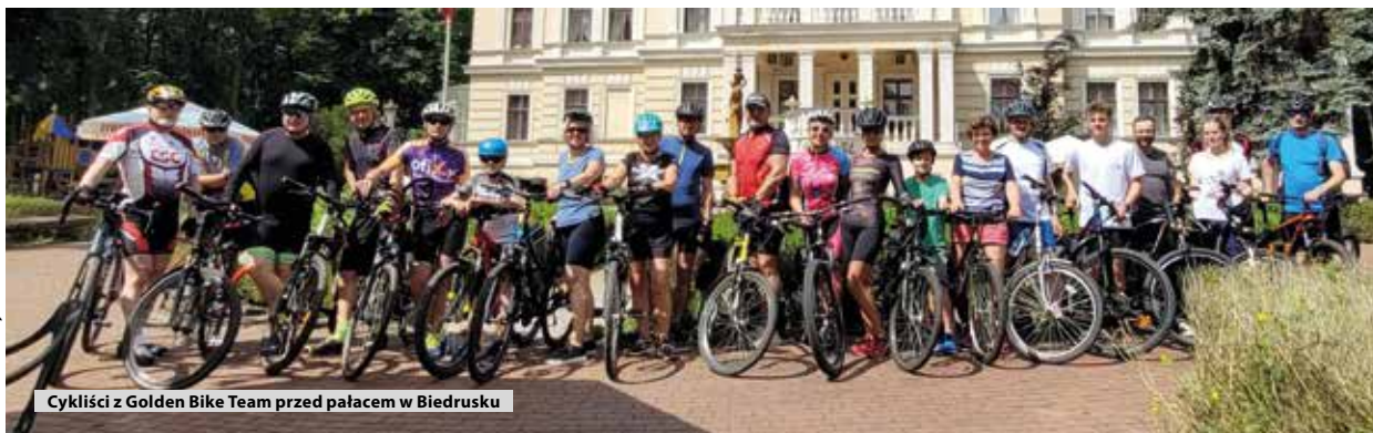
Cyklisty z Golden Bike Team przed pałacem w Biedrusku