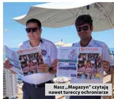
Nasz „Magazyn” czytają nawet tureccy ochroniarze