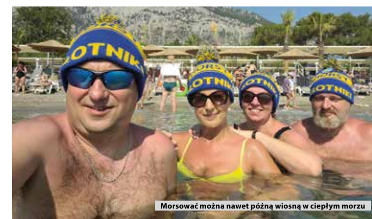
Morsować można nawet późną wiosną w ciepłym morzu