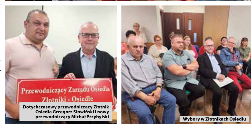
Wybory w Złotnikach Osiedlu