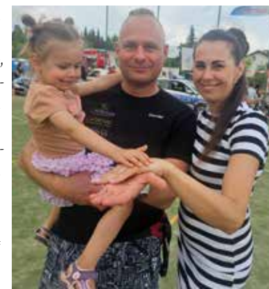
Bawili się całe rodziny

Warto w tym miejscu zaznaczyć, że wspomniany ogród to Domówka Jelonek przy ulicy Sosnowej.