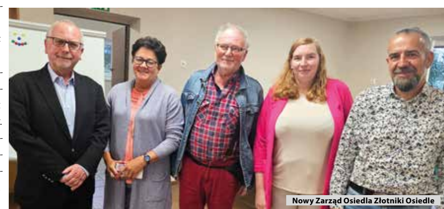
Nowy Zarząd Osiedla Złotniki Osiedle