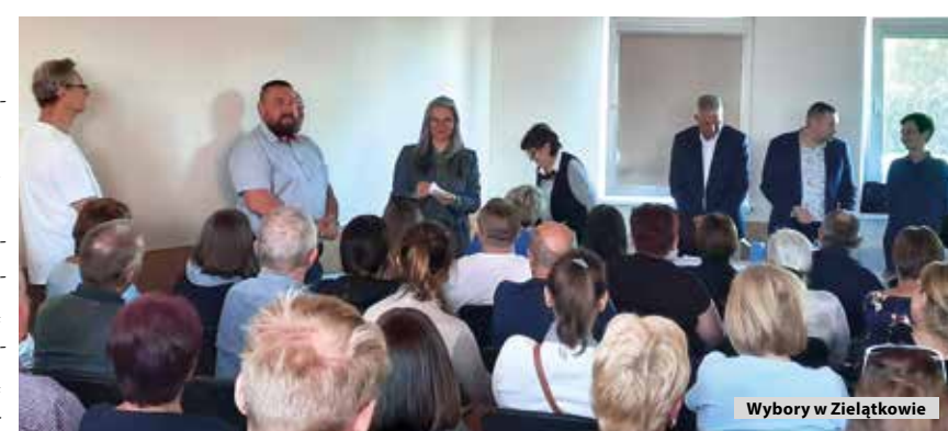
Wybory w Zielątkowie