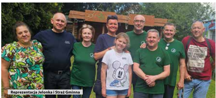
Reprezentacja Jelonka i Straż Gminna