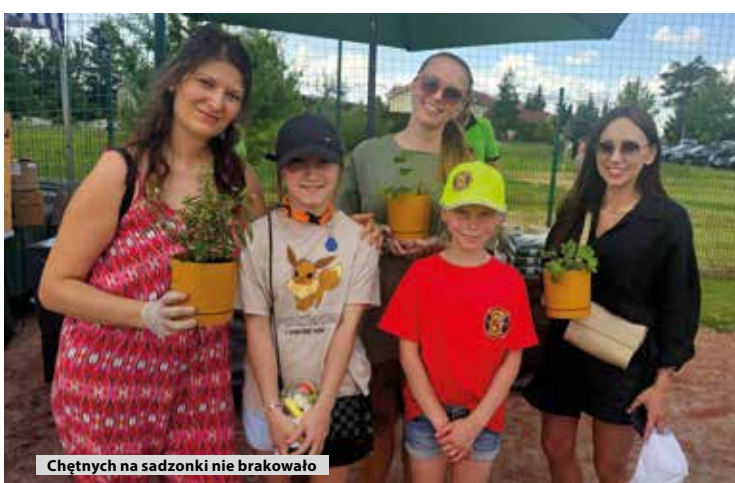
Chętnych na sadzonki nie brakowało