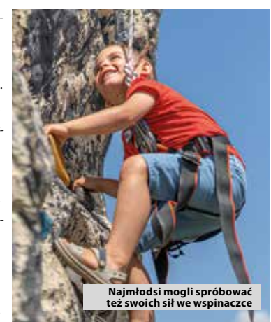
Najmłodszy mógł spróbować też swoich sił w wspinaczce