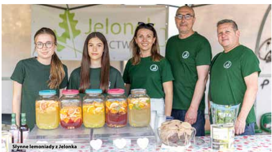
Słonne lemoniady z Jelonka