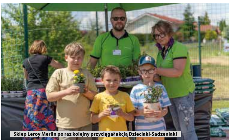
Sklep Leroy Merlin po raz kolejny przyciągał akcją Dzieciaki-Sadzeniaki