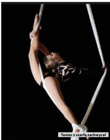
Taniec z szarfą zachwycał