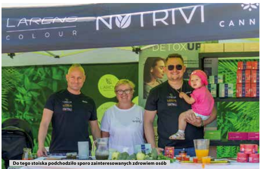
Do tego stoiska podchodziło sporo zainteresowanych zdrowiem osób