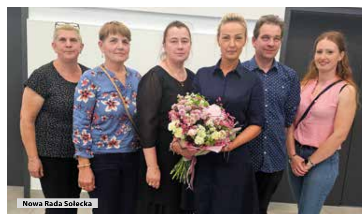
Nowa Rada Sołecka