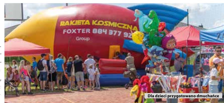
Dla dzieci przygotowano dmuchańce