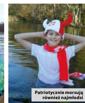
Patriotycznie morsują również najmłodszy