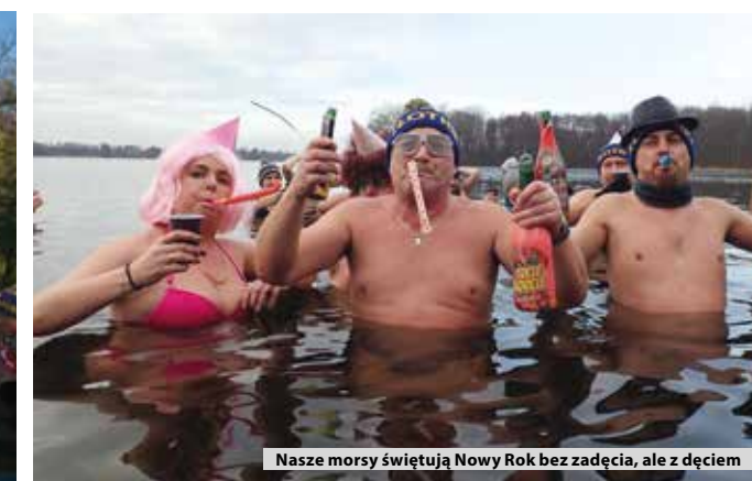
Nasze morsy świętują Nowy Rok bez ządęcia, ale z dęciem

W zeszłym roku kąpielą w czeskim potoku złotnickiej miłośnicy zimnych wód zakończyli morsowy sezon. Tym razem zaś sezon będą kończyć w rzece Kwisa pod Świeradowem-Zdrojem.