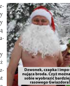
Dzwonek, czapka i imponująca broda. Czyż można sobie wyobrazić bardziej rasowego Gwiazdora?