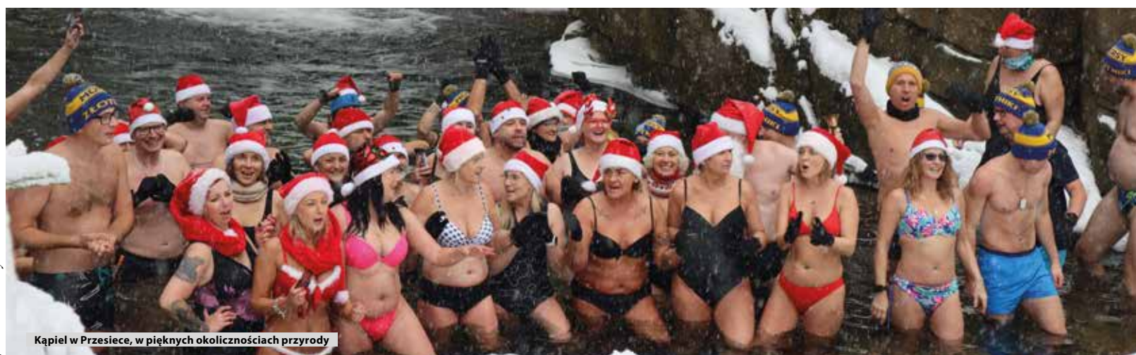
Kąpiel w Przesiece, w pięknych okolicznościach przyrody