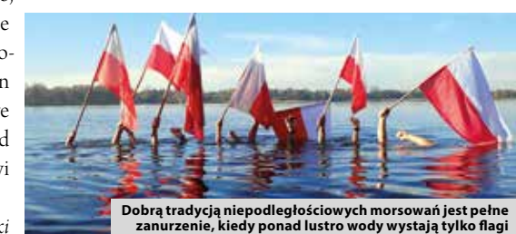
Dobrą tradycją niepodległościowych morsowań jest pełne zanurzenie, kiedy ponad lustro wody wystają tylko flagi