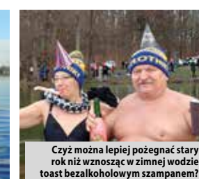
Czyż można lepiej poćgnąć stary rok niż wznosząc w zimnej wodzie toast bezalkoholowym szampanem?