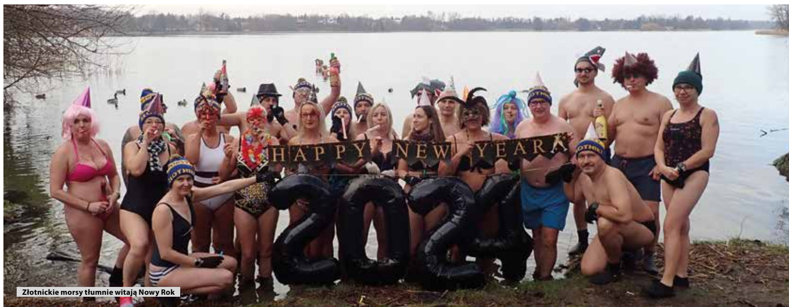
Złotnickie morsy tłumnie witają Nowy Rok