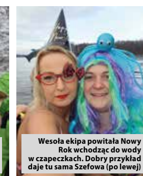
Wesoła ekipa powitała Nowy Rok wchodząc do wody w czapczkach. Dobry przykład daje tu sama Szefowa (po lewej)