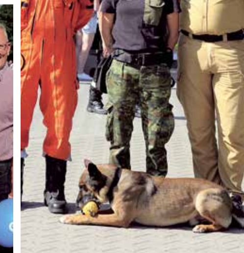
fot. Maciej Łuczakowski - więcej na FB/sucholeski