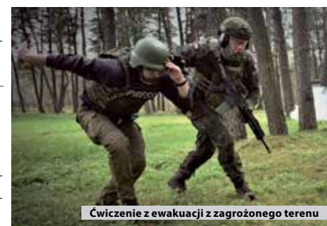
Ćwiczenie z ewakuacji z zagrożonego terenu