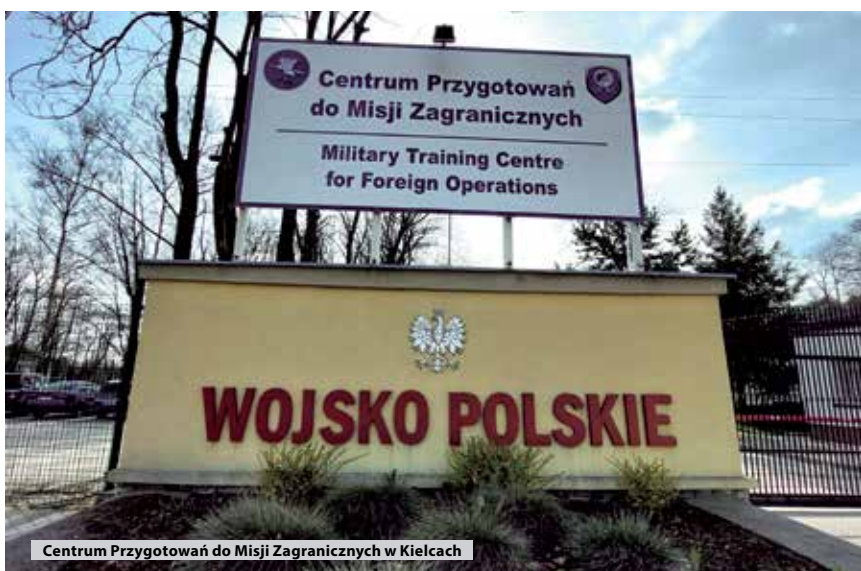
Centrum Przygotowań do Misji Zagranicznych w Kielcach