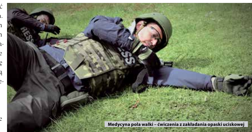
Medycyna pola walki – ćwiczenia z zakładania opaski uciskowej

Na zakończenie uczestnicy kursu dostali certyfikaty, dzięki którym mogą się ubiegać o akredytację na wyjazdy na tereny działań Polskich Kontyngentów Wojskowych. Czy nasz rozmówca się na taką misję zgłosi?