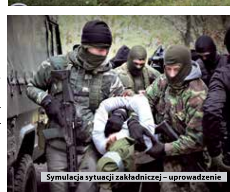
Symulacja sytuacji zakładniczej – uprowadzenie