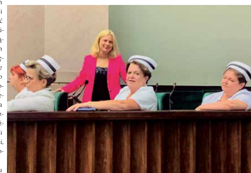
MATERIAŁ KW-NOWA LEWICA