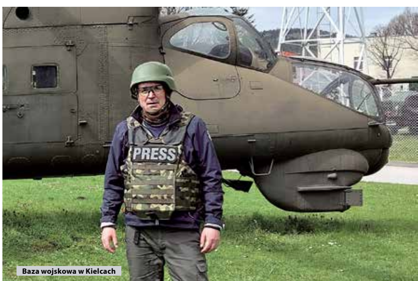
Baza wojskowa w Kielcach