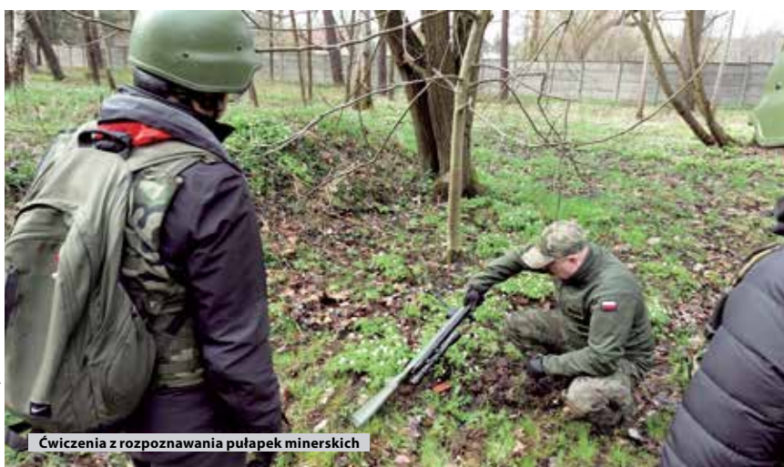
Ćwiczenia z rozpoznawania pułapek minerskich