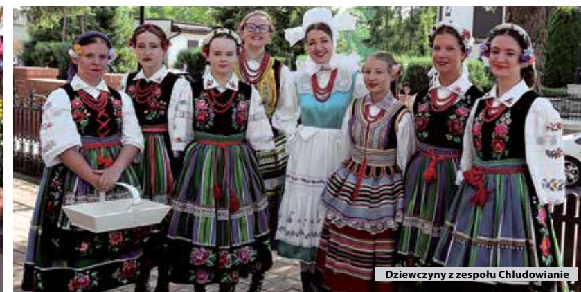
Dziewczyny z zespołu Chłudowianie