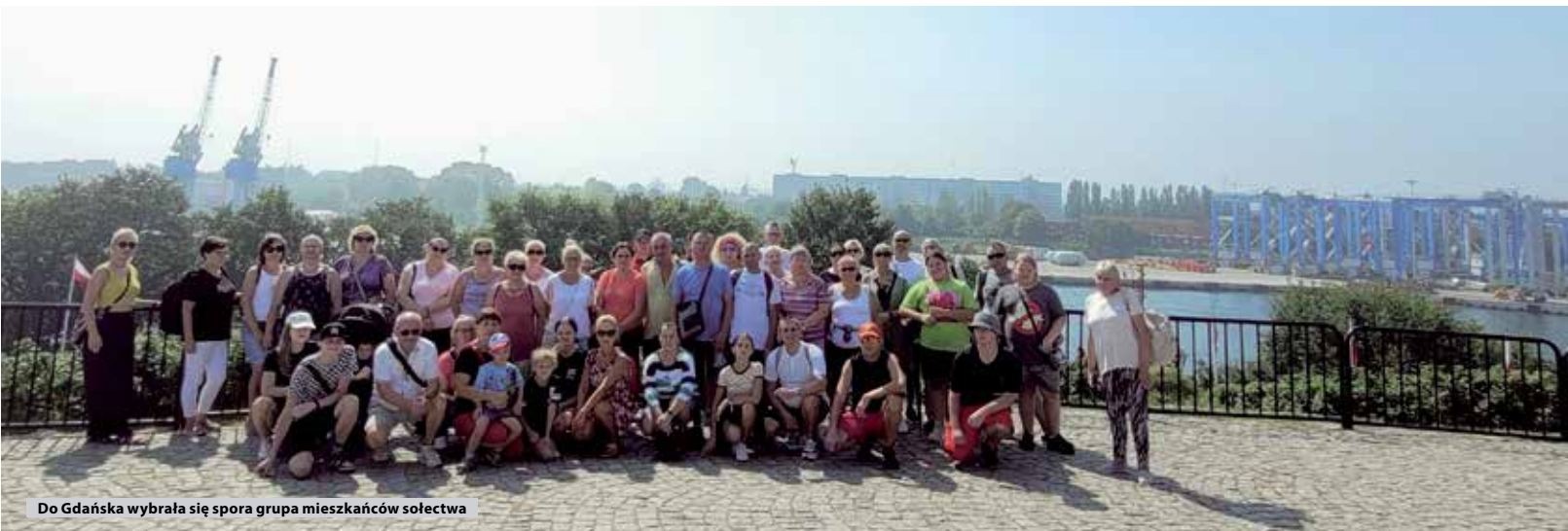
Do Gdańska wybrała się spora grupa mieszkańców sołectwa