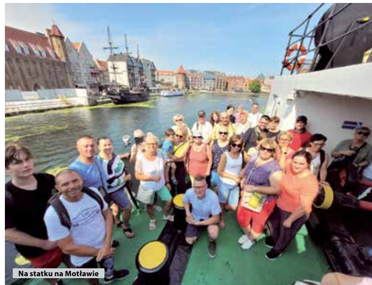
Na statku na Motławie