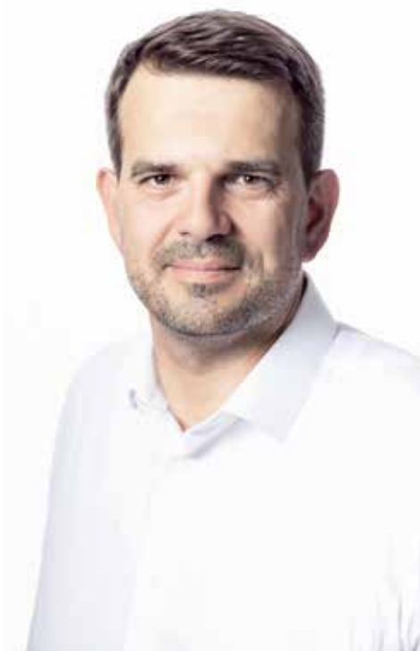
Materiał KWW Trzecia Droga PSL - PL2050 Szymona Holownia

Jako wielki przyjaciel rzemieślników i rolników bardzo wspiera produkcję zdrowej polskiej żywności i postuluje wprowadzenie stawki 0 proc. VAT na żywność wytwarzaną w sposób tradycyjny.