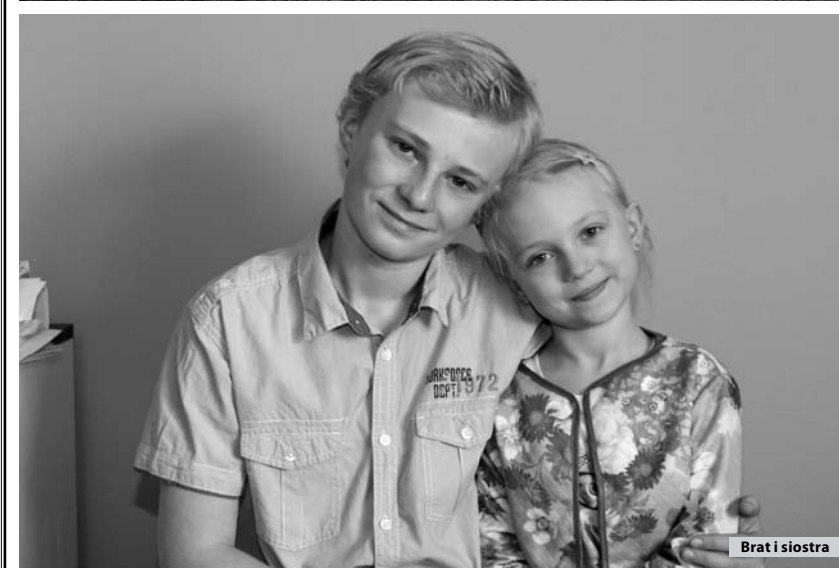
Brat i siostra

fol. Maciej Luczakowski, więcej na FB/sucholeski