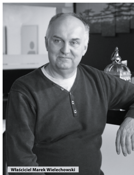
fot. Maciej Łuczowski, więcej na FB/sucholeski