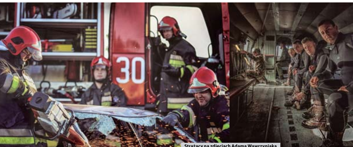
Strażacy na zdjęciach Adama Wawrzyniaka

fot. Maciej Łuczowski, więcej na FB/sucholeski