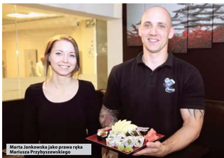
fot. Maciej Łuczowski, więcej na FB/sucholeski