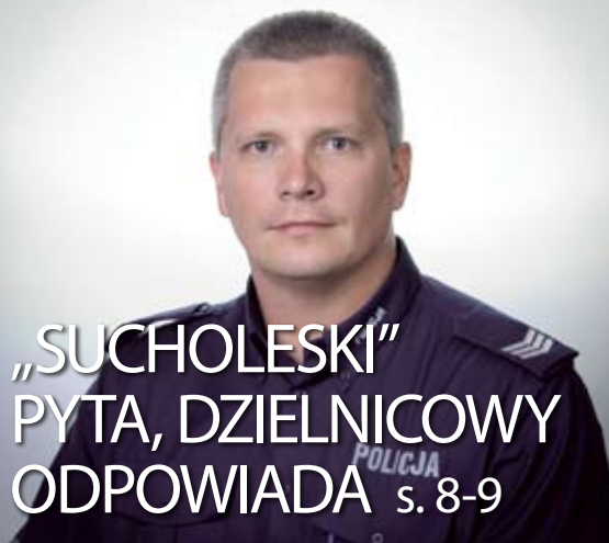
„SUCHOLESKI” PYTA, DZIELNICOWY ODPOWIADA s. 8-9