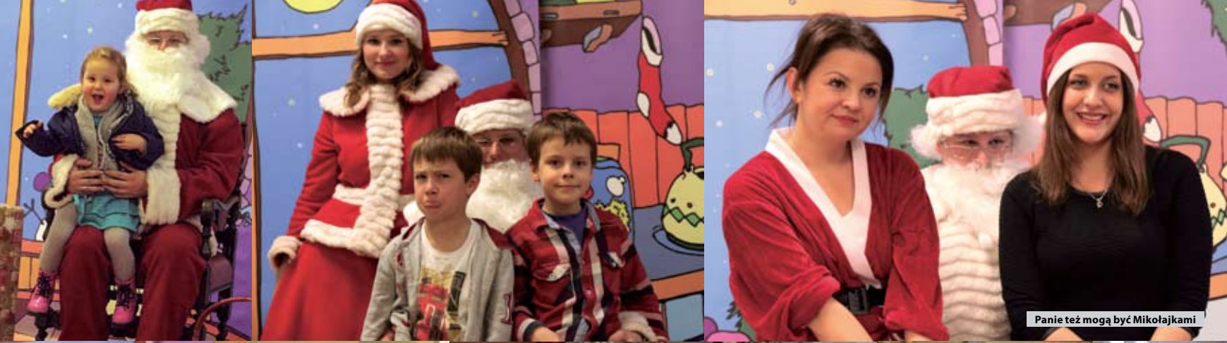
Panie też mogą być Mikołajkami