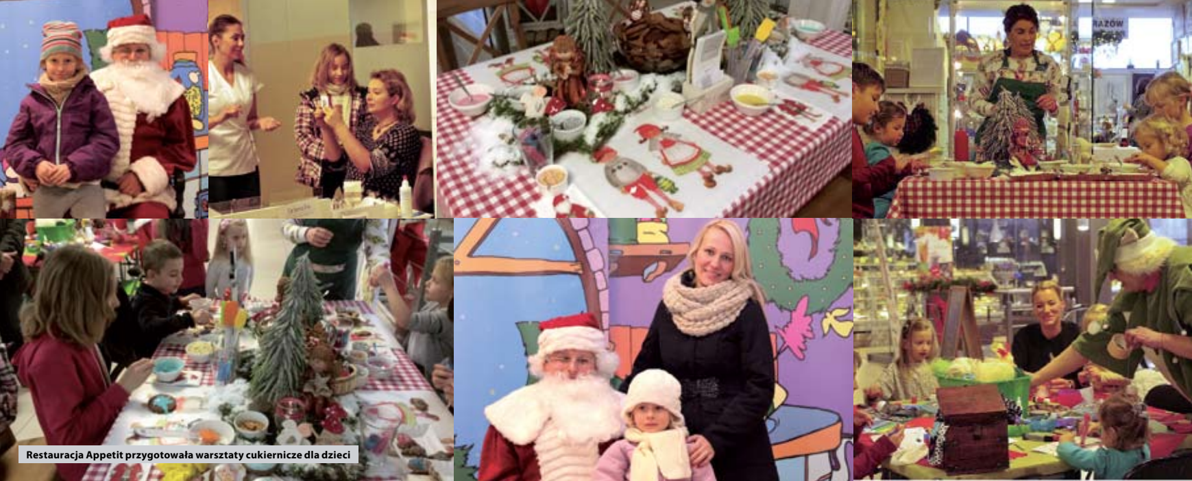
Restauracja Appetit przygotowała warsztaty cukiernicze dla dzieci