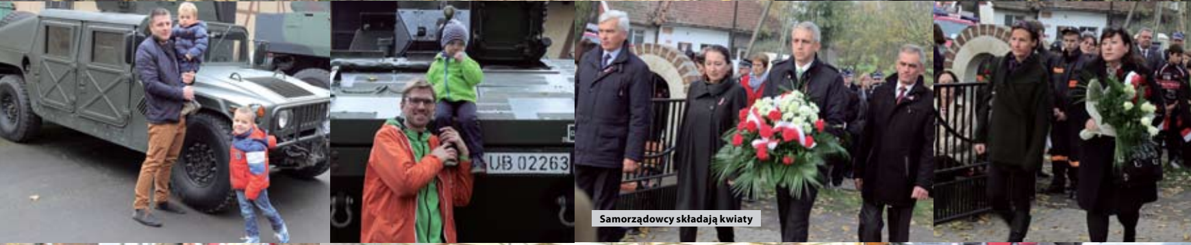
Samorządowcy składają kwiaty