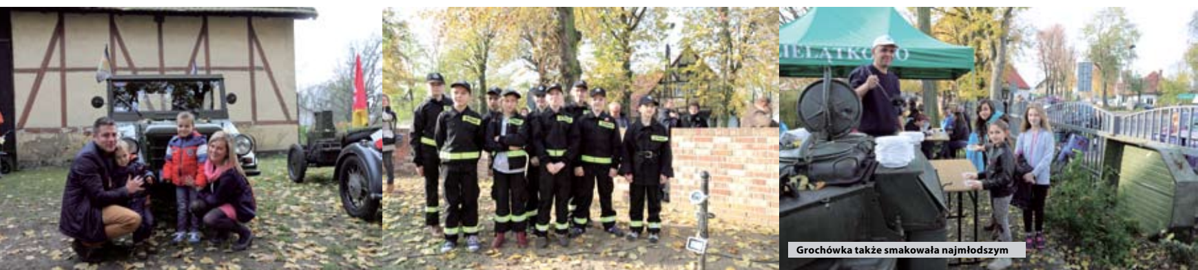
Gołcówka także smakowała najmłodszym