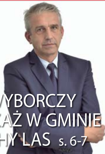
POWYBORCZY PEJZAŻ W GMINIE SUCHY LAS s. 6-7