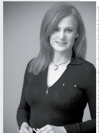
fryzura wykonana przez Sultana Uroby, Awangarda