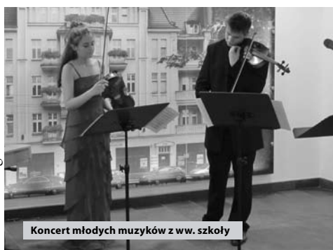
Koncert młodych muzyków z ww. szkoły