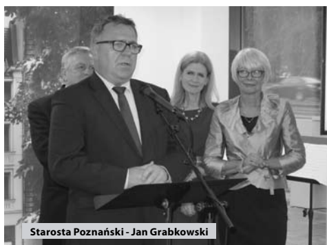
Starosta Poznański - Jan Grabkowski