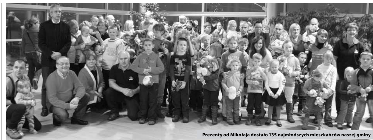
Prezenty od Mikołaja dostało 135 najmłodszych mieszkańców naszej gminy

Na taką prośbę Święty nie mógł pozostać obojętny. W czerwonej czapce i kubraku, z białą brodą, wzbudzał nieklamany zachwyt wśród najmłod-