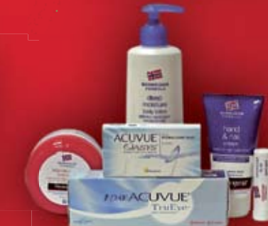
Opakowanie soczewek Acuvue 69 zł kosmetyki Neutrogeny w prezencie Perfect Eye Optic