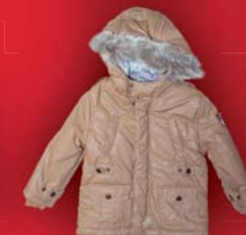
Kurtka dziecięca -20% F. Mayoral butik Uno