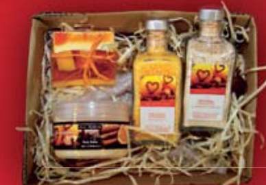
Zestaw kosmetyków do pielęgnacji ciała Stara Mydlarnia