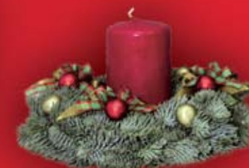
Bombki i ozdoby świąteczne Kwiaciarnia Cattleya