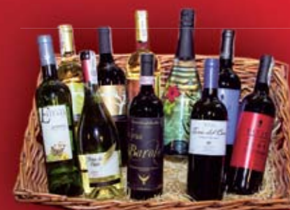
Wino – szeroki wybór Fabryka Wina