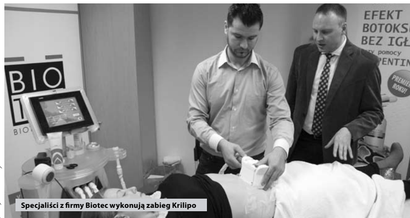
Specjaliści z firmy Biotec wykonują zabieg Krilipo

Gabinet Kosmetologii Estetycznej Cykas wprowadza klientów w świat młodości i piękna. W ofercie znajdziemy nowoczesne zabiegi, dotyczące twarzy i ciała. Z okazji urodzin firmy w Salonie Skoda Sunny spotkały się mieszkanki Poznania i okolic, aby w miłej atmosferze przyjrzeć się oferowanym zabiegom.