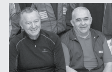
Turniej dwóch Andrzejów 11