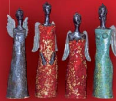
Anioł ceramiczny 99 zł Artdecoy