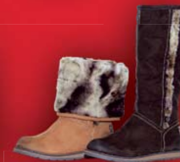
Kozaki zamszowe 299 zł Tamaris