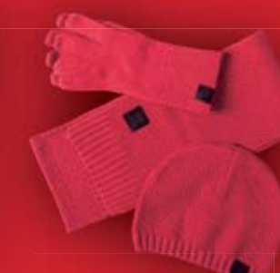
Komplet dziecięcy 159 zł Tommy Hilfiger Multibrand store