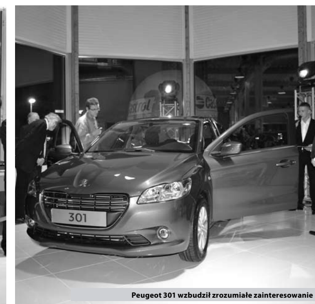
Peugeot 301 wzbudził zrozumiałe zainteresowanie