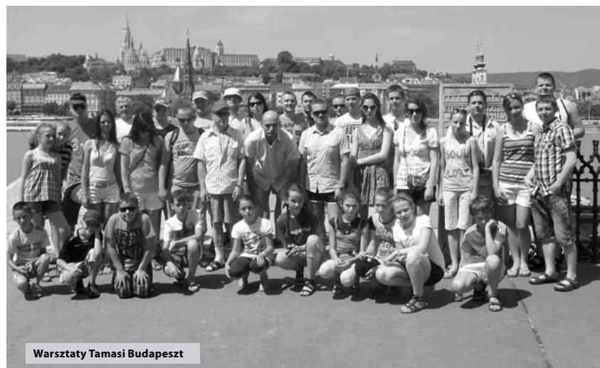
Warsztaty Tamasi Budapeszt