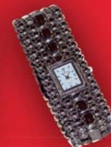
Zegarek 119 zł Bibiboba