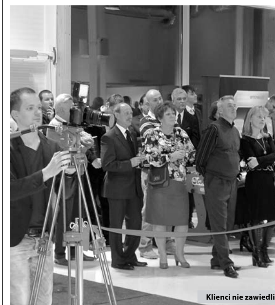
Klienci nie zawiedli