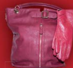
Torebka 139 zł rękawiczki 69 zł Butik Aldona

Niech świąteczne prezenty wyrażają nas i nasze dobre uczucia. Życzymy, aby takie właśnie podarunki udało się Państwu znaleźć w Galerii Sucholeskiej. Podczas świątecznych zakupów pamiętajmy także o wymarzonym prezencie dla siebie. Zapraszamy!