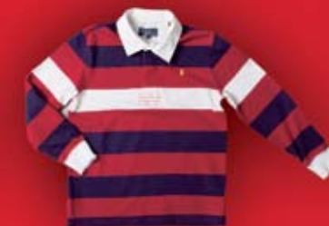
Polo chłopięce 109 zł Ralph Lauren Multibrand store