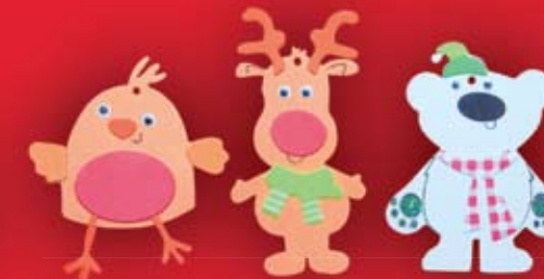
Zabawki kreatywne „zrób to sam” od 9,90 zł Stoisko z zabawkami