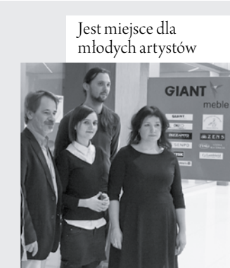
12 Jest miejsce dla młodych artystów