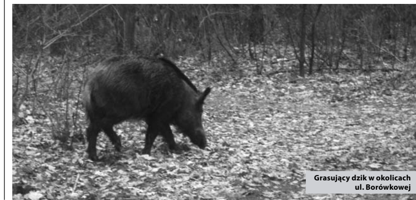
Grasujący dzik w okolicach ul. Borówkowej