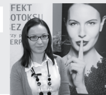
28 Czuj się młodo i pięknie