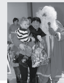
9 Święta się zbliżają wielkimi krokami