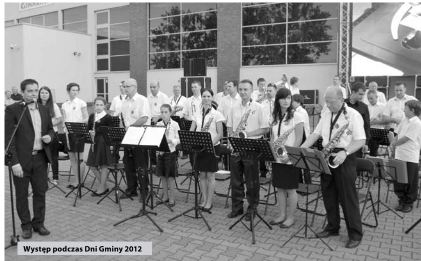
Występ podczas Dni Gminy 2012