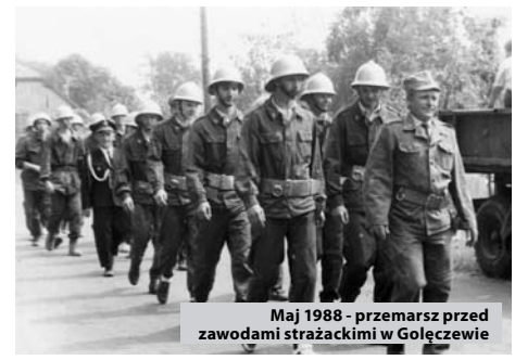
Maj 1988 - przemarsz przed zawodami strażackimi w Gołęczewie