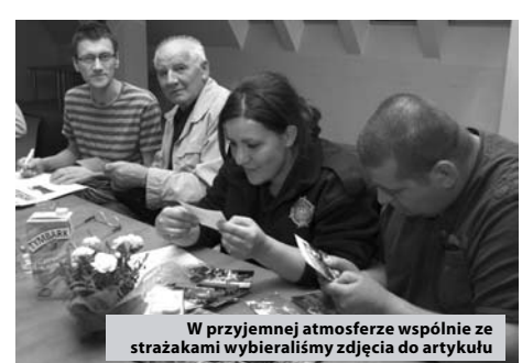
W przyjemnej atmosferze wspólnie ze strażakami wybieraliśmy zdjęcia do artykułu