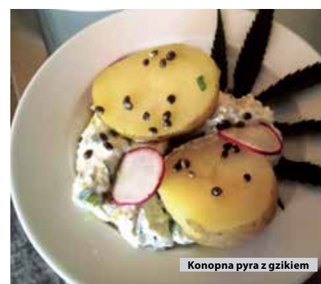
Konopna pyra z gzikiem

gościom swoje wariacje na temat „konopnej pyry z gzikiem”. W ich lokalach możliwa była też degustacja innych dań z konopiami, zarówno z liśćmi, jak i z olejem.