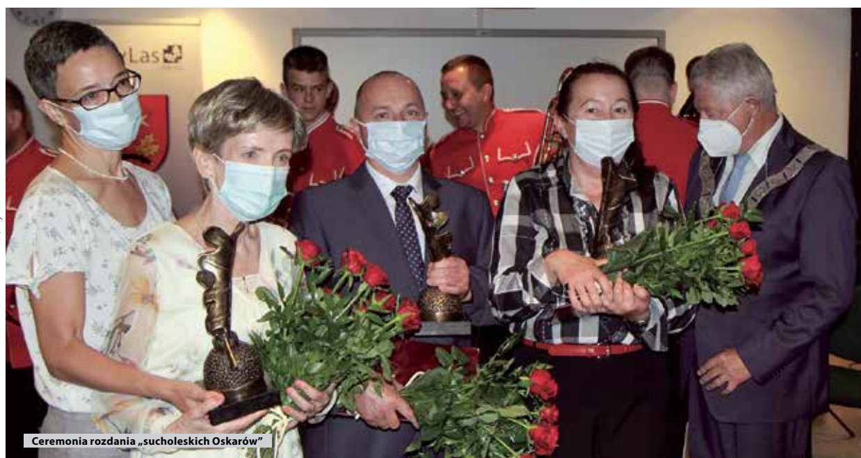
Ceremonia rozdania „sucholeskich Oskarów”