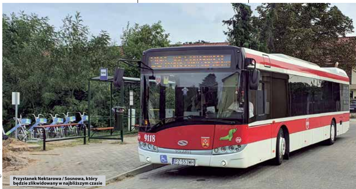
Przystanek Nektarowa / Sosnowa, który będzie zlikwidowany w najbliższym czasie