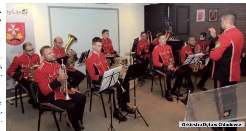
Orkiestra Dęta w Chłudowie

zadeklować trzy hasła: solidarność i partnerstwo, wartości i ludzka empatia. Partnerstwo realizujemy też na niwie międzynarodowej, co pozwala nam w pełni poczuć się Europejczykami. Dlatego chcemy uhonorować osoby zaangażowane w tę działalność. Parafrazując słowa drugiej osoby w państwie, możemy dziś powiedzieć: tu jest Suchy Las, tu jest Polska i tu jest Europa!