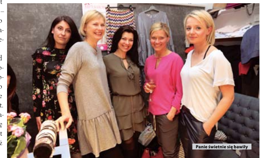
Panie świetnie się bawiły