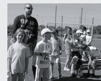
Bądź sportowcem, posadź drzewa