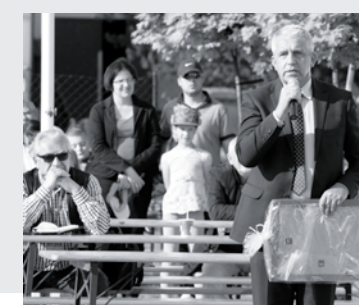
22 Uroczysty i... bojowy jubileusz OSP w Chłudowie