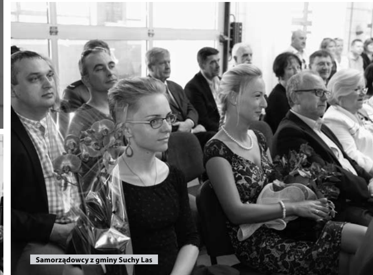
Samorządowcy z gminy Suchy Las