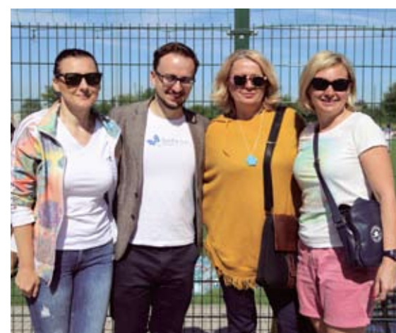
fot. Maciej Łuczowski - więcej na FB/Sucholeski