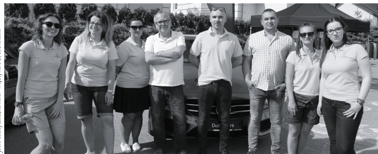
fot. Maciej Łuczowski - więcej na FB/sucholeski