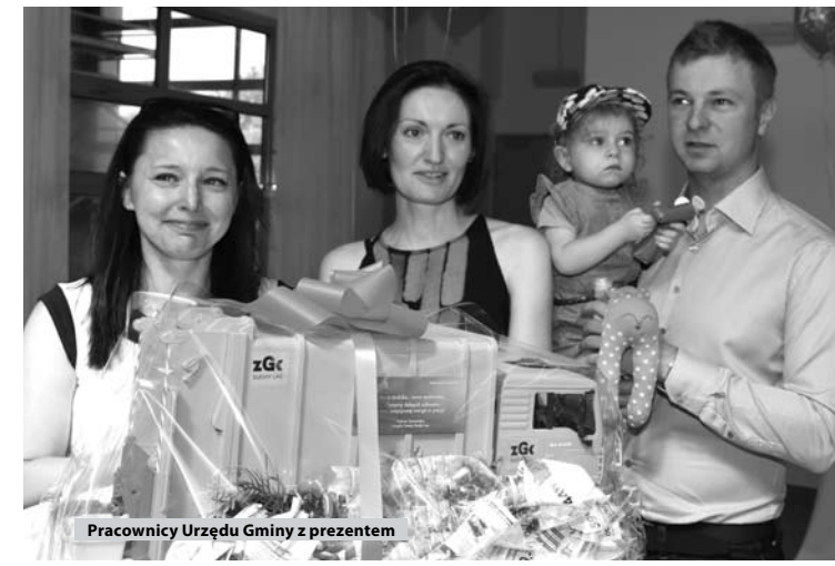
Pracownicy Urzędu Gminy z prezentem