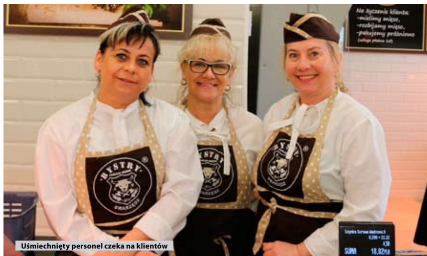
Uśmiechnięty personel czeka na klientów