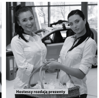
Hostessy rozdają prezenty