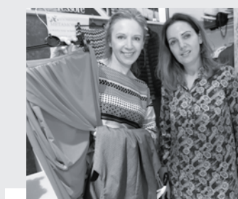
Wizażystka i stylistka na pomoc kobietom