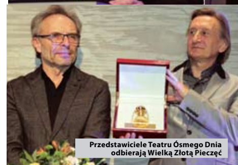
Przedstawiciele Teatru Ósmego Dnia odbierają Wielką Złotą Pieczęć