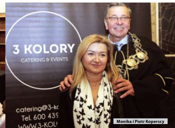
3 KOLORY CATERING & EVENTS catering@3-ko Tel. 600 435 WWW.3-KOLORY.PL