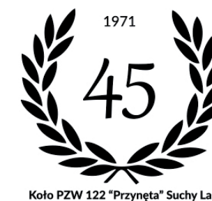
Koło PZW 122 "Przynęta" Suchy Las