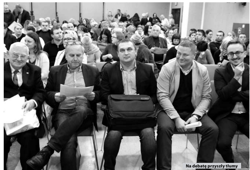
Na debatę przyszły tłumy