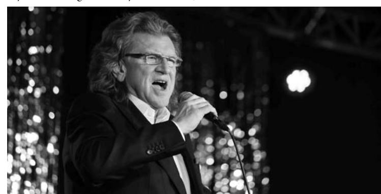
fot. Maciej Łuczowski - więcej na FB/sucholeski