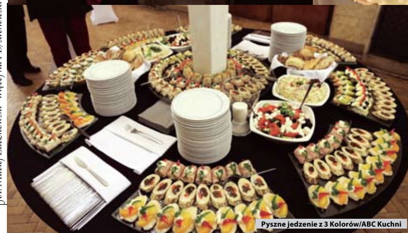
Pyszne jedzenie z 3 Kolorów/ABC Kuchni