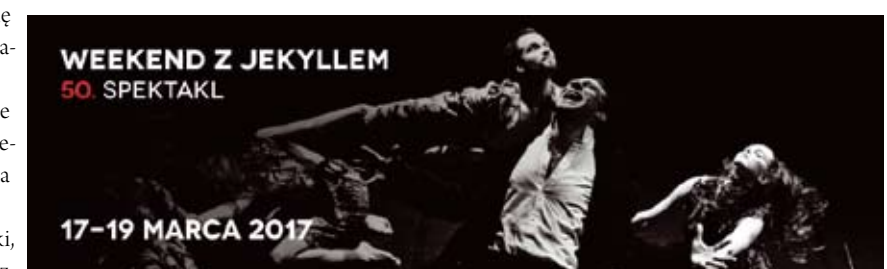
WEEKEND Z JEKYLLEM 50. SPEKTAKL