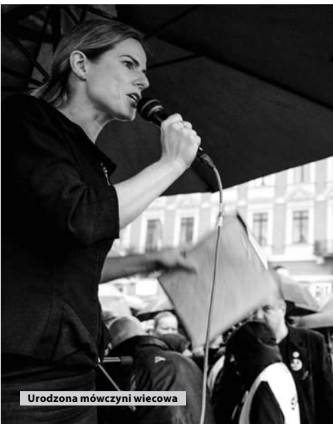
Urodzona mówczyni wiecowa