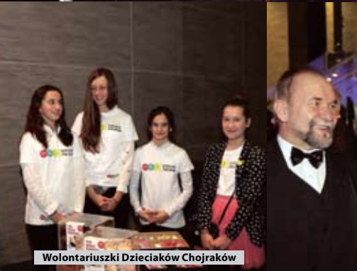
Wolontariuszki Dzieciaków Chojraków