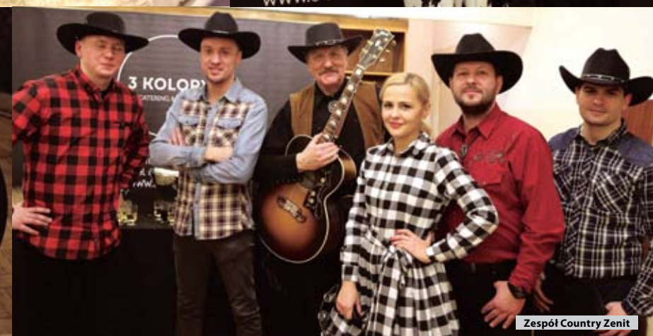
Zespół Country Zenit

fot. Maciej Luczkowski - więcej na FB/sucholeski